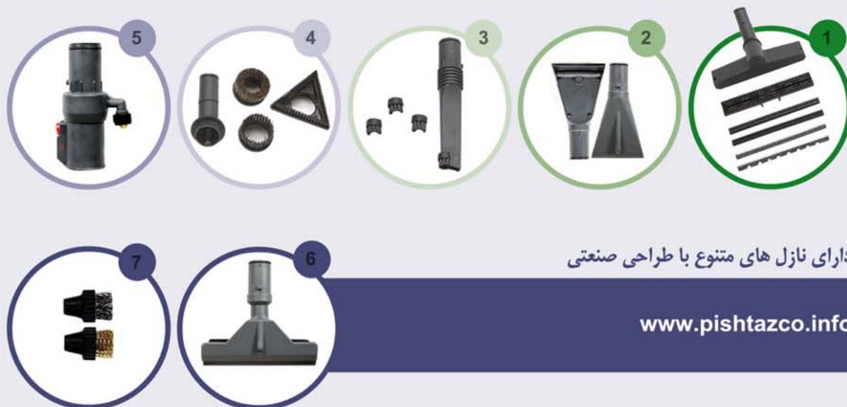
دارای نازل های متنوع با طراحی صنعتی